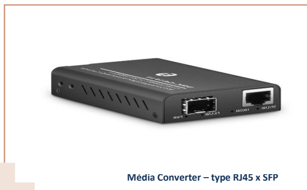
Média Converter – type RJ45 x SFP